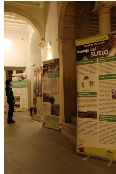
Exhibición de paneles sobre Agroecología Universidad Internacional de Andalucía, sede de Antonio Machado (UNIA) , Baeza 2008