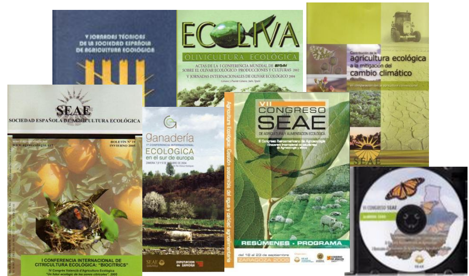
Actas Congresos SEAE y dossiers

Asesoramiento presencial y virtual Catarroja (Valencia) 2009