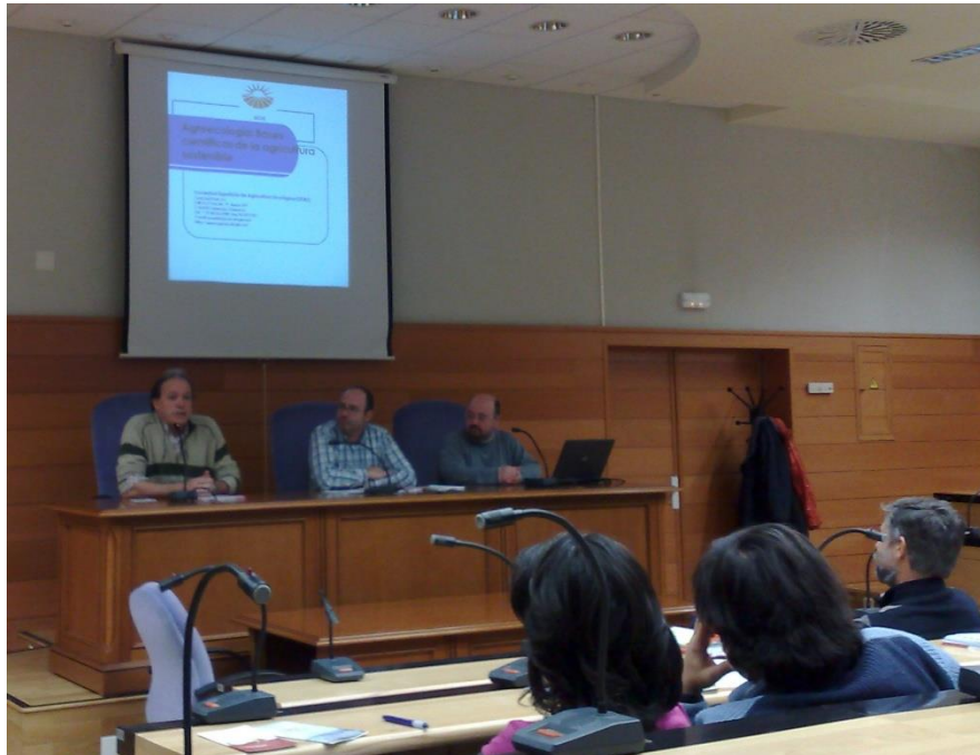
Charla sobre Agroecología . Universidad de Jaén 2008