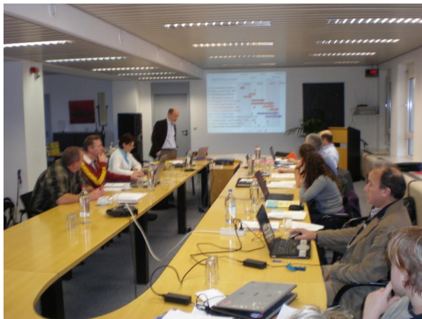
Reunion proyecto ORGAP (Organic Action Plan)